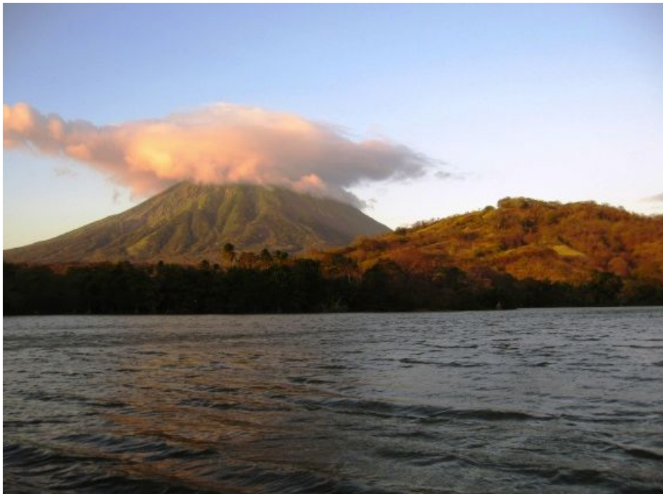
Le Nicaragua, entre lacs et volcans... !